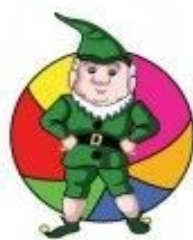
in front of